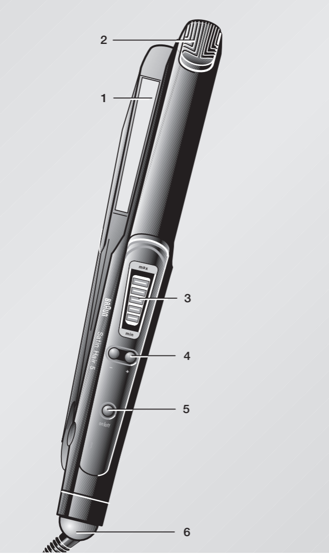
A B C